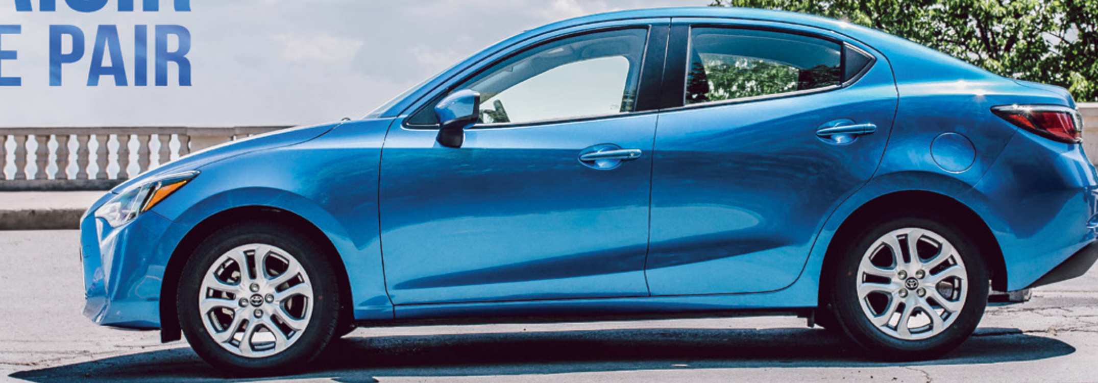
Yaris berline montrée en Bleu intense métallisé.